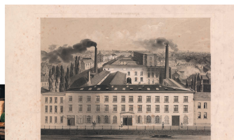
18. Lithografie van de katoenspinnerij Lousbergs, 1840

De familie Lousbergs, met Nederlandse roots, bouwt in de 19e eeuw een waar textielimperium uit. De katoenspinnerij van de Lousbergs aan de Reep is halverwege de 19e eeuw de grootste van Gent, met zo'n 1500 arbeiders.