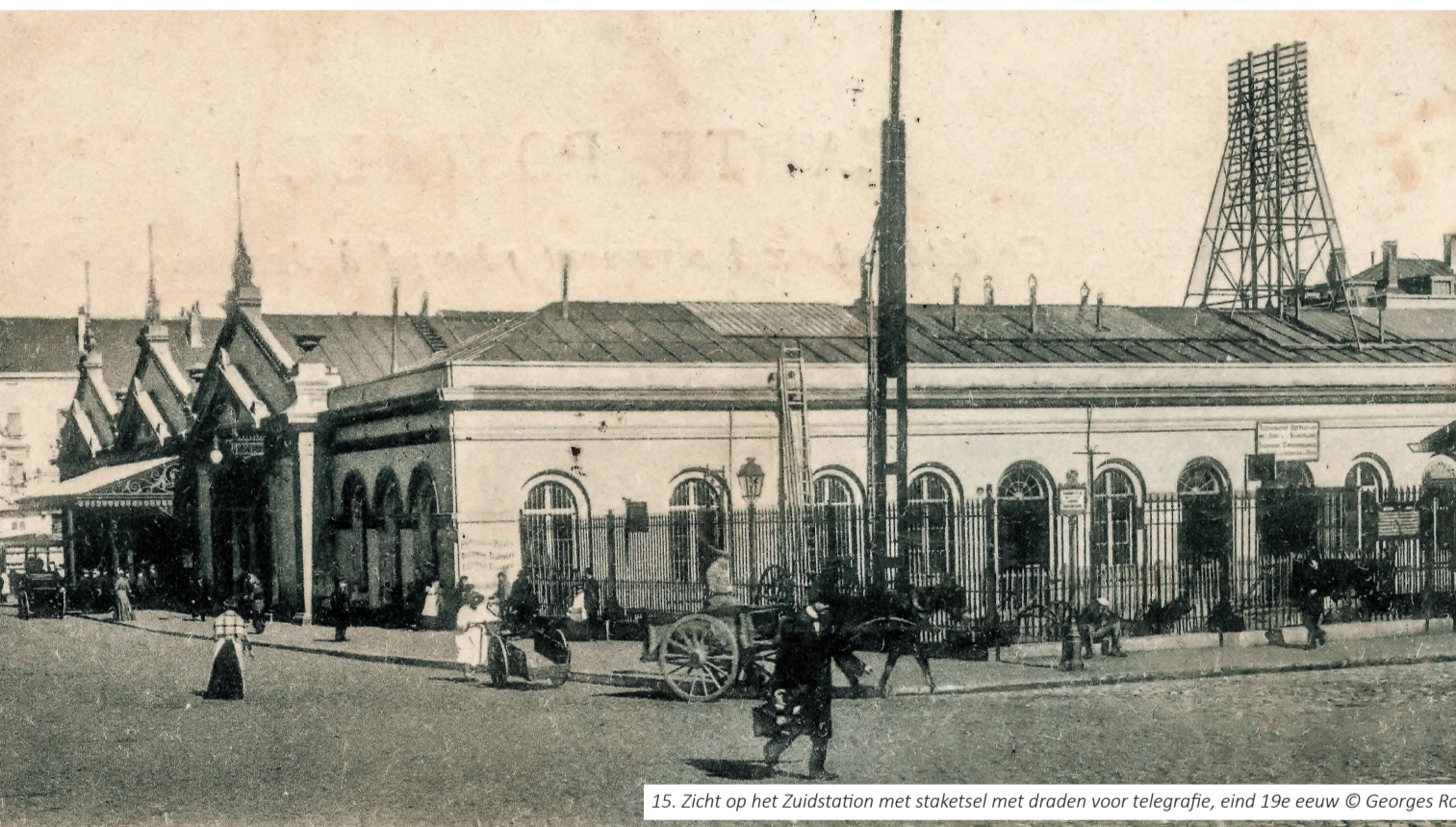
15. Zicht op het Zuidstation met staketsel met draden voor telegrafie, eind 19e eeuw

In 1837 bolt de eerste stoomtrein het Zuidstation binnen, aan het huidige Woodrow Wilsonplein. 'Den ijzeren weg' geeft een boost aan de verschillende Gentse industrieën. Tonnen ijzer, hout en steenkool worden er aangevoerd via het spoor.