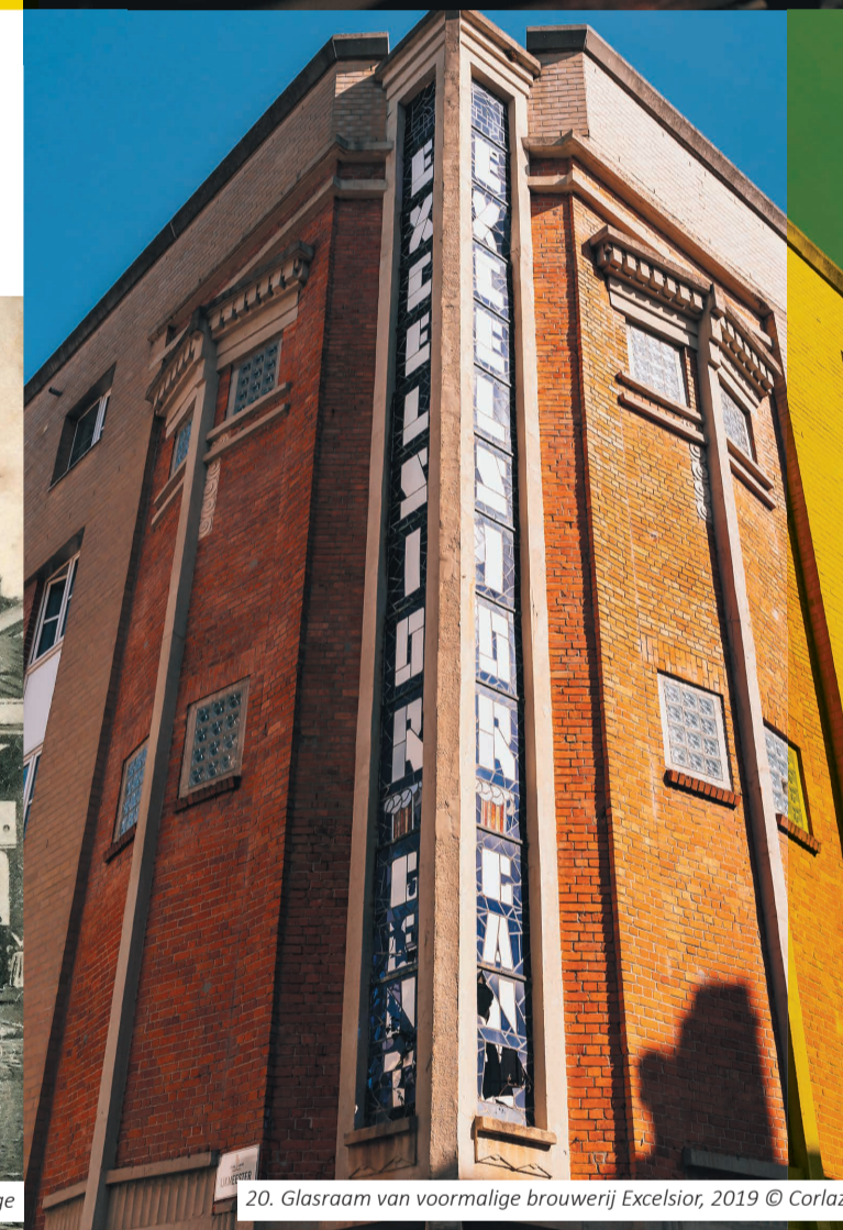
20. Glasraam van voormalige brouwerij Excelsior, 2019 © Corlazzoli