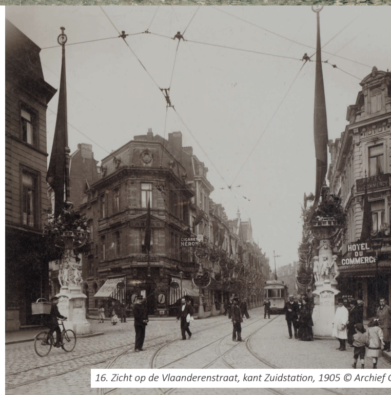
16. Zicht op de Vlaanderenstraat, kant Zuidstation, 1905

Op deze plek ontstaat een nieuwe boulevard, als verbinding tussen het zuidstation en het centrum van de stad.