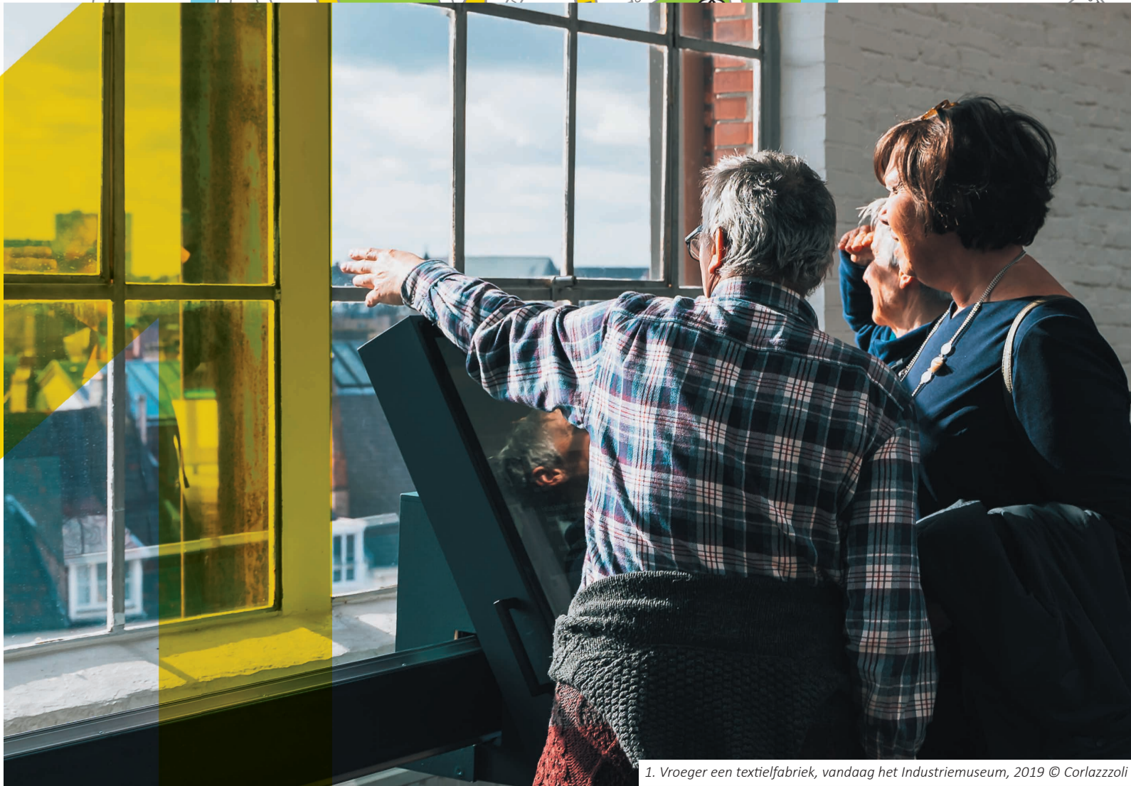
1. Vroeger een textiel fabriek, vandaag het Industriemuseum, 2019

In de 14e eeuw al is de Huidenvetterskaai het toneel van grote bedrijvigheid én de place to be voor leerloaiers.