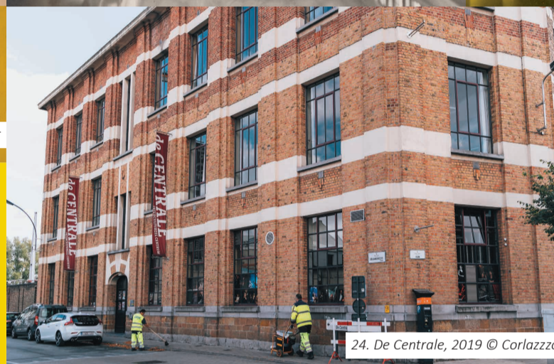
24. De Centrale, 2019