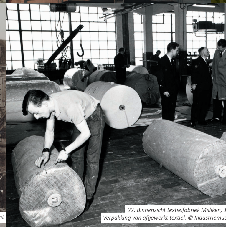
22. Binnenzicht textiefabriek Milliken, 1965. Verpakking van afgewerkt textiel.