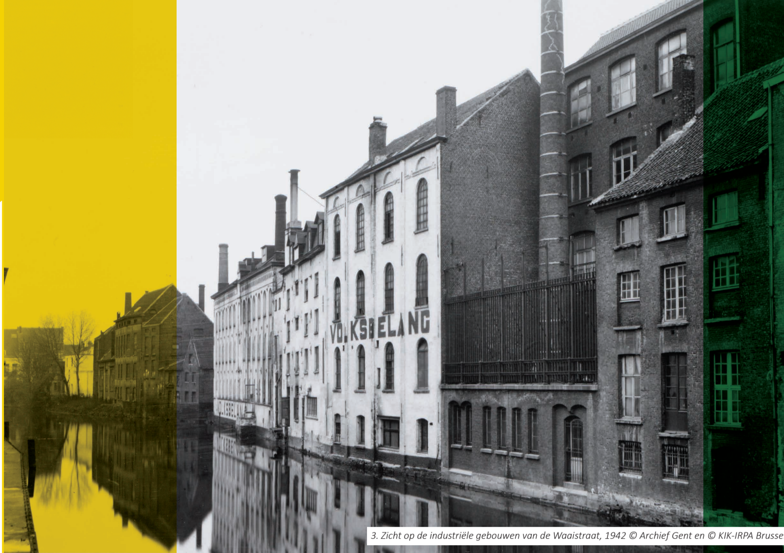
3. Zicht op de industriële gebouwen van de Waaistraat, 1942

Een rolpaal is namelijk een hulpmiddel bij het 'jagen' van schepen, waarbij men of paard het schip met een touw voorttrekt. Rolpalen staan in de bocht van een rivier. Bij het nemen van de bocht legt de schipper een koord om de paal. Door tegenroer te geven, zorgt de schipper ervoor dat de boot de kant niet raakt.