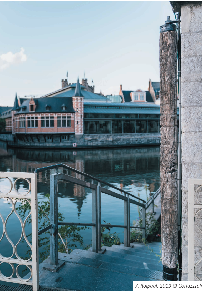
7. Rolpaal, 2019