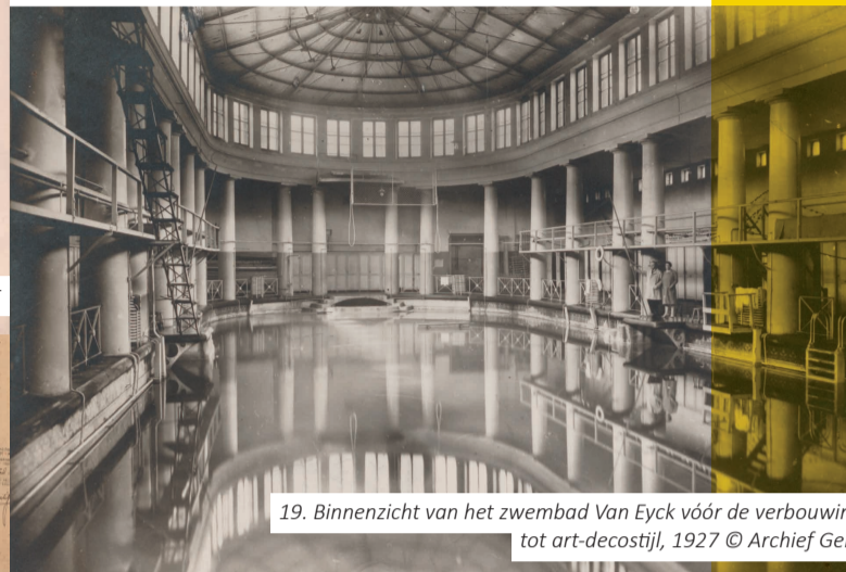
19. Binnenzicht van het zwembad Van Eyck vóór de verbouwing tot art-decostijl, 1927

Het opvallende gebouw ter hoogte van huisnummer 50 is aanvankelijk een kopergeterij. Vandaag huist hier creatiehuis Kopergetery.