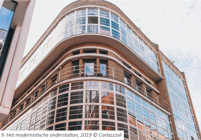
9. Het modernistische onderstation, 2019