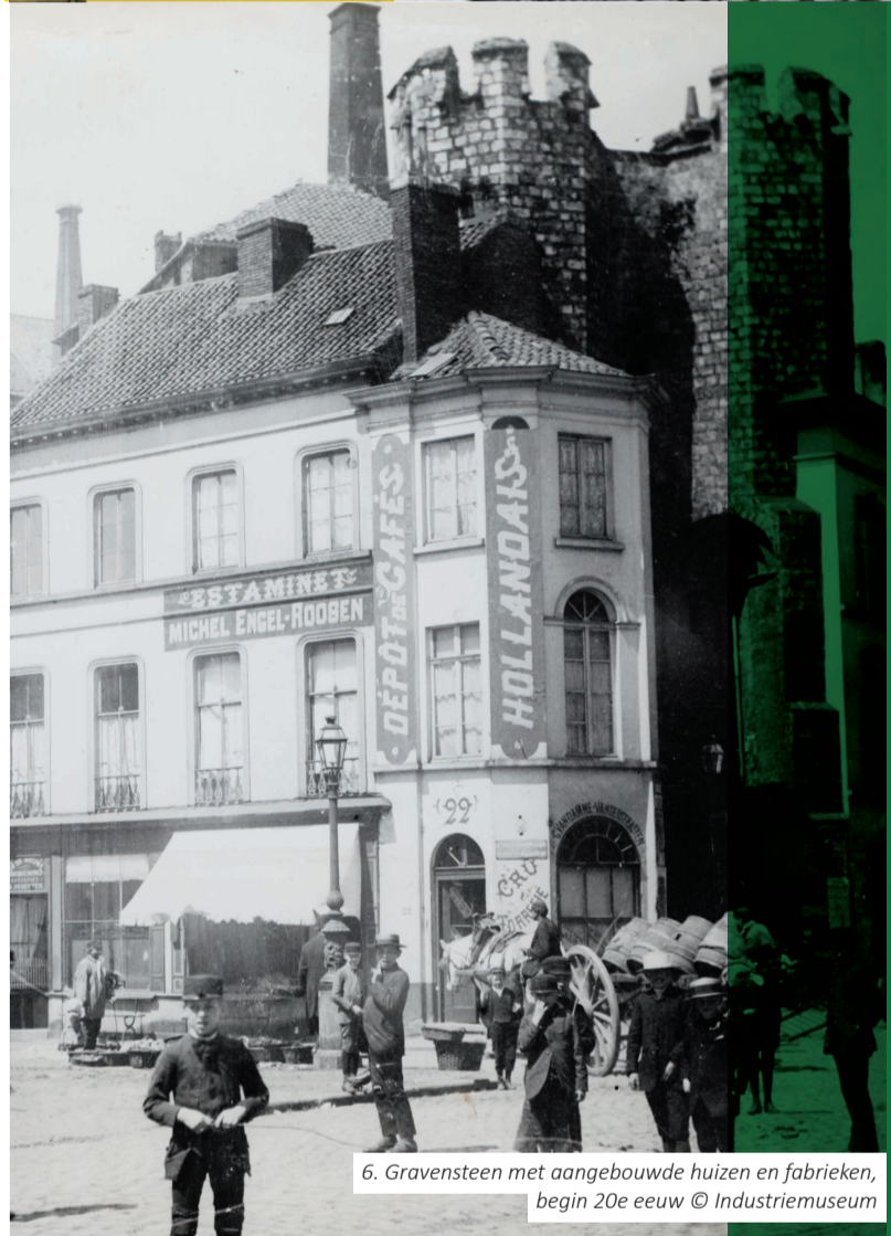
6. Gravensteen met aangebouwde huizen en fabrieken, begin 20e eeuw

Vanaf het begin van de 20e eeuw drukken de financiële instellingen hun stempel op de Kouter. De imposante bankgebouwen hebben beneden een ruime lokettenzaal en prestigieuze ontvangstruimtes. Nu verlaten de financiële instellingen gaandeweg het stadscentrum. De ruime panden ondergaan een herbestemming tot wooneenheden.