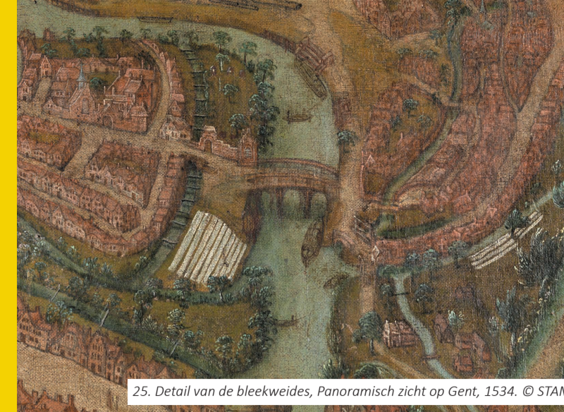
25. Detail van de bleekweides, Panoramisch zicht op Gent, 1534.