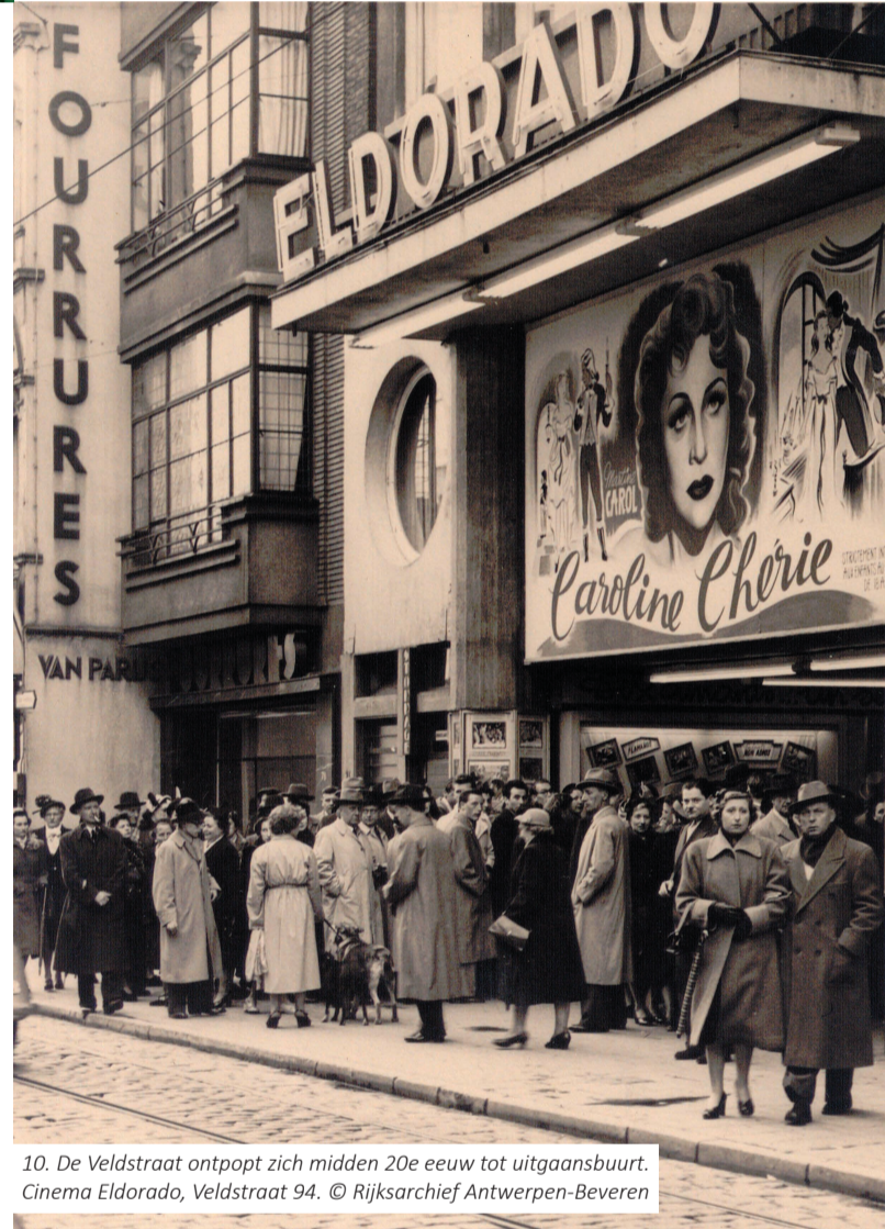
10. De Veldstraat ontloopt zich midden 20e eeuw tot uitgaansbuurt. Cinema Eldorado, Veldstraat 94.