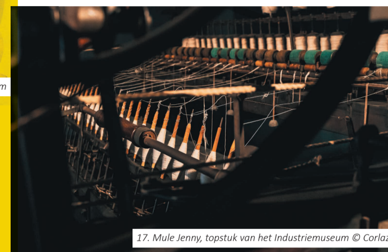
17. Mule Jenny, topstuk van het Industriemuseum

Ondanks zijn betwiste figuur richt het Gentse stadsbestuur in 1885 een standbeeld voor Lieven Bauwens op.