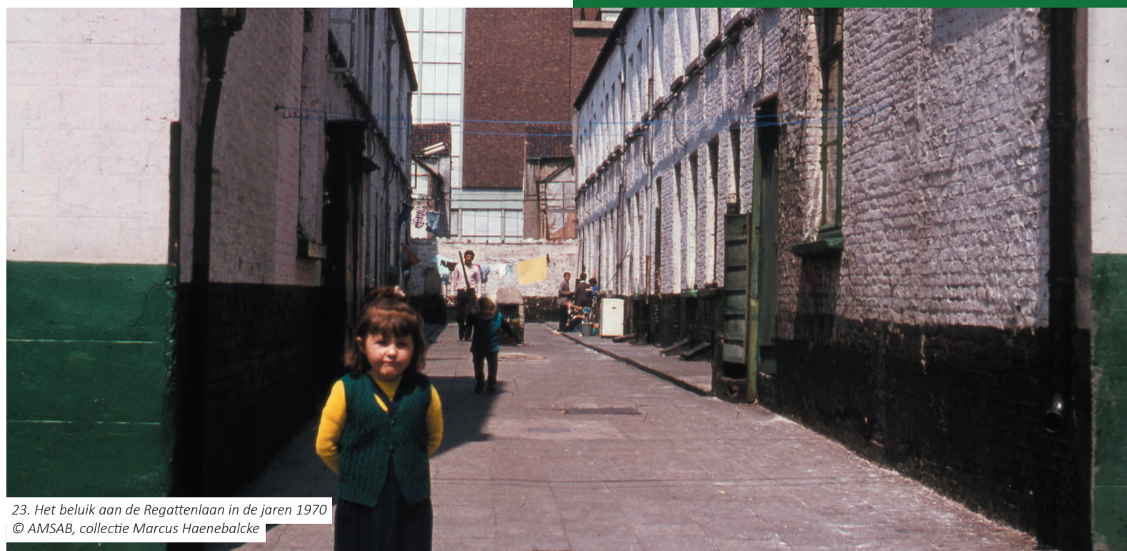
23. Het beluik aan de Regattenlaan in de jaren 1970

Aan de overkant van het park zie je een gerenoveerd beluik.